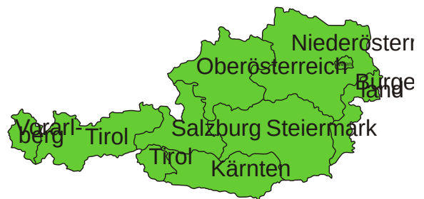
Karte Österreich Bundesländer