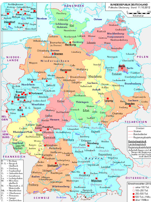
Deutschland politisch 2010

Schaut euch jetzt erst die Karten genauer an. Welche Länder Kantone kanntet ihr nicht? Kennt ihr auch die Hauptstädte der Länder in D? Was wollt ihr noch besser kennenlernen?