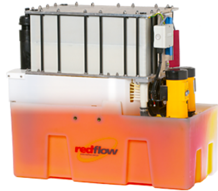
Kompakte RedFlow -Batterie

Es gibt verschiedene Ideen, für die Nutzung von Redox-Flow-Batterien. Eine davon ist eine Idee einer betankbaren Batterie für Autos. Statt eine Batterie aufzuladen, werden einfach die verbrauchten Elektrolyte ausgetauscht, was schneller geht.