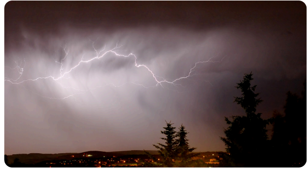
Ein Blitz in den Wolken

Blitze sind ein beeindruckendes Naturschauspiel. Sie entstehen durch elektrische Aufladung in Gewitterwolken. Aber auch aus unserem Alltag ist Elektrizität nicht wegzudenken. Lampen, Computer, Smartphones, Wasserkocher, Mikrowellenherde und zukünftig auch Autos werden mit elektrischem Strom