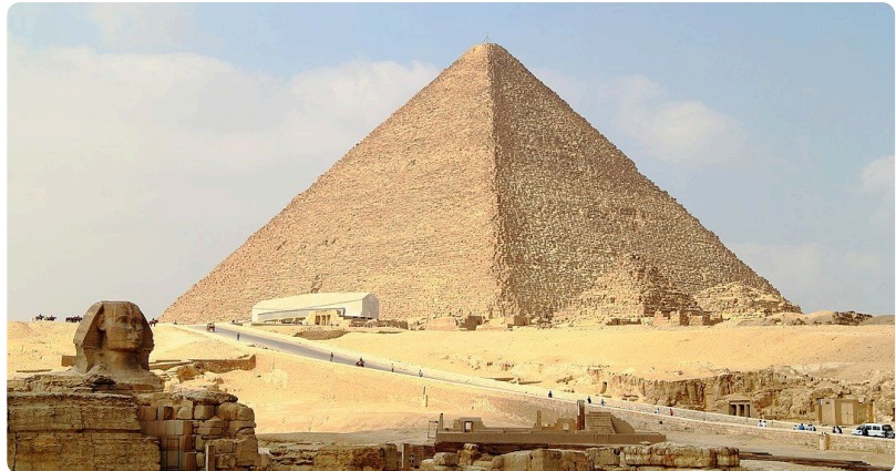
M1: Die Cheops-Pyramide 2015,

Zusammen mit den beiden anderen Pyramiden bildet sie das Ensemble (die Gruppe) der Pyramiden von Gizeh . Entdecke die Pyramide virtuell, erfahre etwas über ihre Entstehung und beurteile selbst, ob die Pyramiden von Gizeh zu Recht den Titel eines „Weltkulturerbes“ tragen.