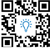
M1 Digitaler Zeitstrahl https://t1p.de/CarlHeine