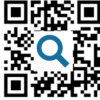
M2 Wikipedia-Artikel https://t1p.de/heinewiki