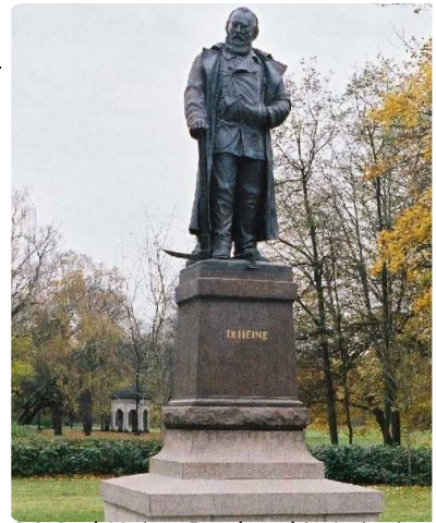
Q1 Carl-Heine-Denkmal in Leipzig