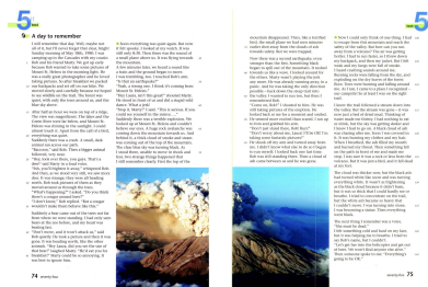
Klett, GLN3 Bayern, Unit 5

in den Vorstunden lesen SuS einen Text zu einem Vulkanausbruch, zwei der Protagonisten treffen sich 20 Jahre später zu einem Gespräch