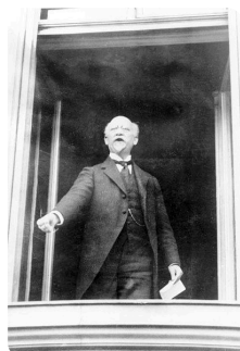
Bild: Philipp Scheidemann in der Reichskanzlei

9. November 1918: Ausrufung der Republik in Berlin