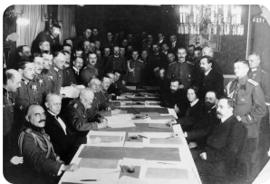
Bild: Unterzeichnung des Waffenstillstands, Wikimedia, Bundesarchiv, Bild 183-R92623 / CC-BY-SA 3.0

3. März. 1918: Frieden von Brest Litowsk