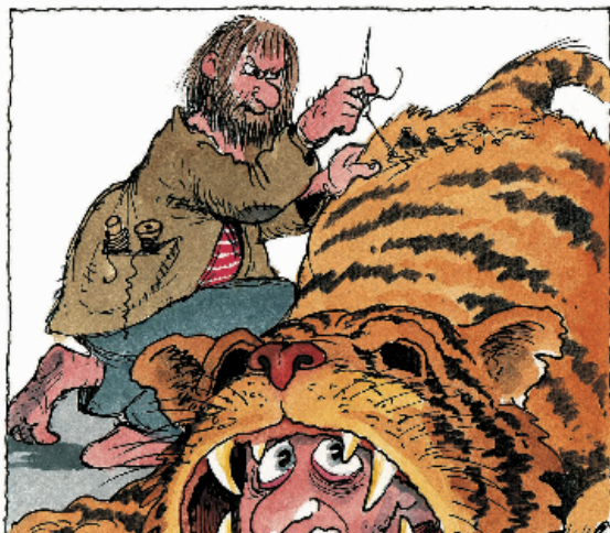
Lachen der Jugend, Deutscher Jugend Verlag