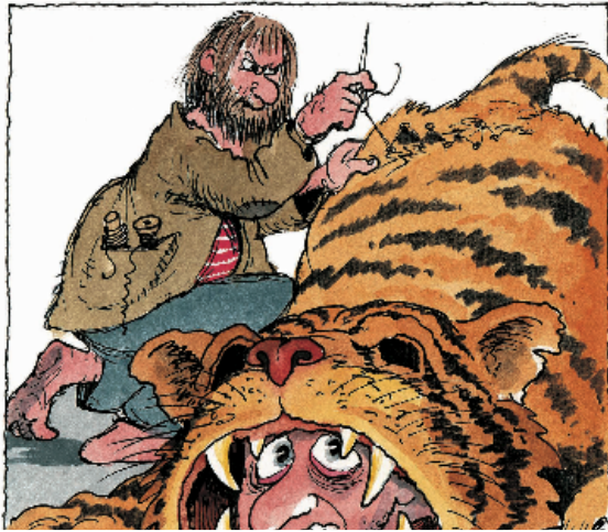
Lachen der Jugend, Deutscher Jugend Verlag