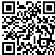
Beistrich im zusammengesetzten Satz