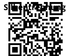
Fälle des Nomens