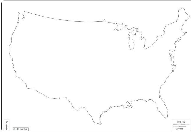
K1 stumme Karte USA