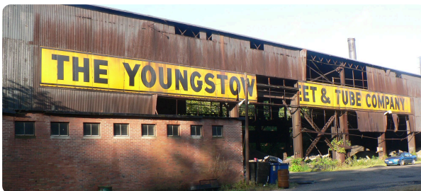
M6: Ehemalige Fabrik in Youngstown