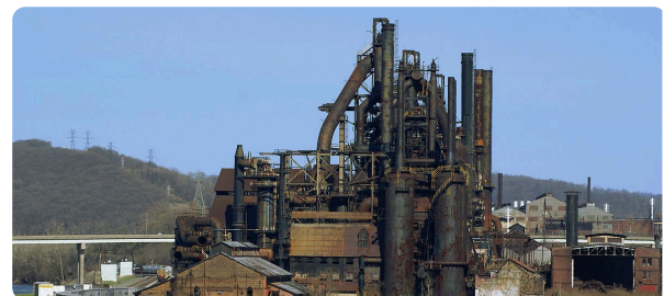
M7: Ehemalige Fabrik in Allentown