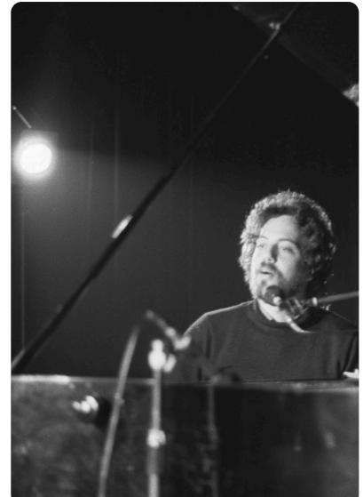
M4: Billy Joel (1972)