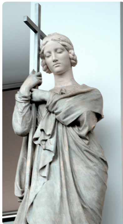
Q4 Plastik der Regententugend 3 (1831- 1834)