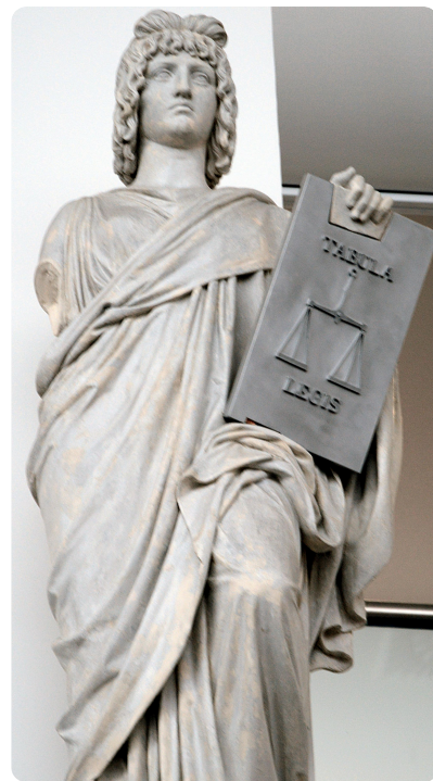
Q3 Plastik der Regententugend 2 (1831- 1834)