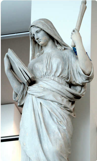
Q2 Plastik der Regententugend 1 (1831- 1834)