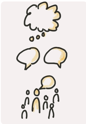
think - pair - share