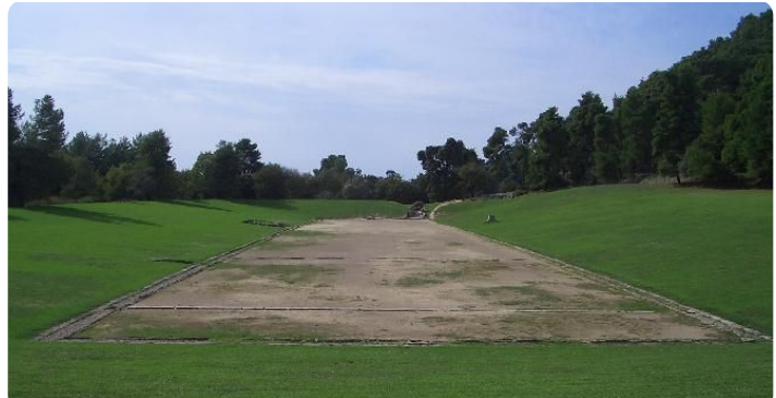
M1: ehemaliges Stadion von Olympia im Jahr 2004

Jede_r von euch hat sicher schon einmal von den Olympischen Spielen gehört. Das ist ein Sportereignis, an dem SportlerInnen aus der ganzen Welt teilnehmen und sich in verschiedenen Disziplinen messen. Die Olympischen Spiele haben eine sehr lange Geschichte. Ihre Wurzeln führen zurück in das antike Griechenland.