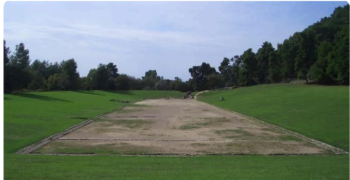
M1: ehemaliges Stadion von Olympia im Jahr 2004

Jede_r von euch hat sicher schon einmal von den Olympischen Spielen gehört. Das ist ein Sportereignis, an dem SportlerInnen aus der ganzen Welt teilnehmen und sich in verschiedenen Disziplinen messen. Die Olympischen Spiele haben eine sehr lange Geschichte. Ihre Wurzeln führen zurück in das antike Griechenland.