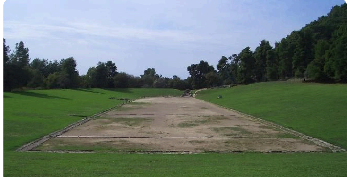
M1: ehemaliges Stadion von Olympia im Jahr 2004

Jede_r von euch hat sicher schon einmal von den Olympischen Spielen gehört. Das ist ein Sportereignis, an dem SportlerInnen aus der ganzen Welt teilnehmen und sich in verschiedenen Disziplinen messen. Die Olympischen Spiele haben eine sehr lange Geschichte. Ihre Wurzeln führen zurück in das antike Griechenland.