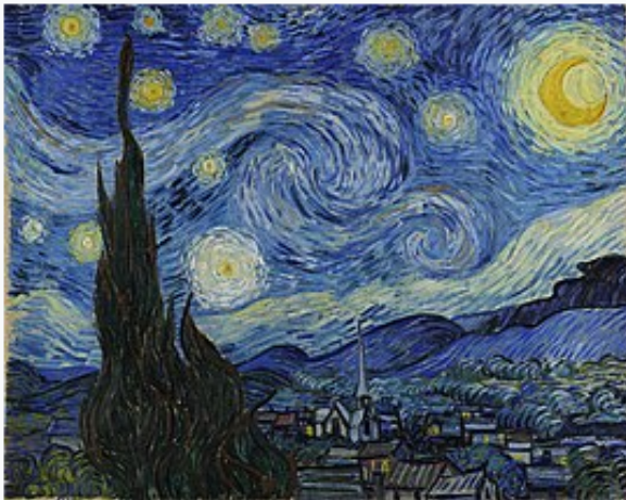
The Starry Night