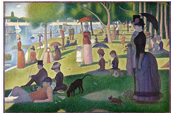
A Sunday Afternoon on the Island of La Grande Jatte