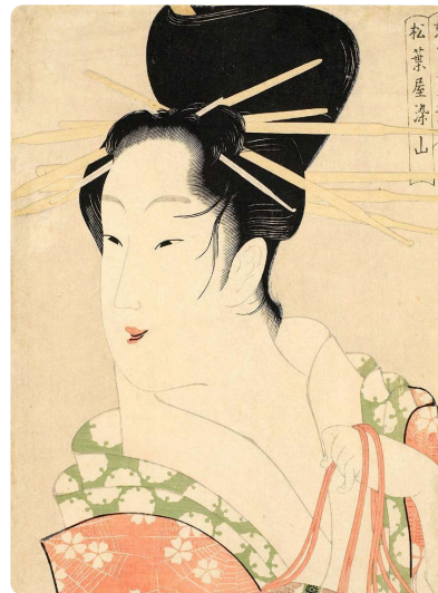
Chōkōsai Eishō (1795-1801): Die Kurtisane Someyama