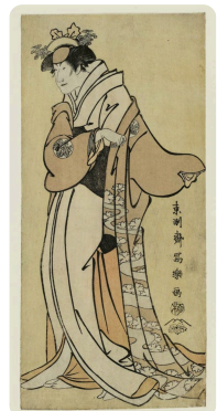
Kitao Masanobu (1772-1780): Die Schauspielerin Nakayama Tomisaburō