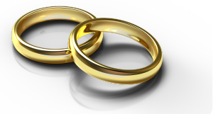
Goldring und Messingring

⑥ Entwickle ein Experiment um zu überprüfen, ob ein Schmuckstück aus teurerem Gold, oder einfachem Messig hergestellt wurde.