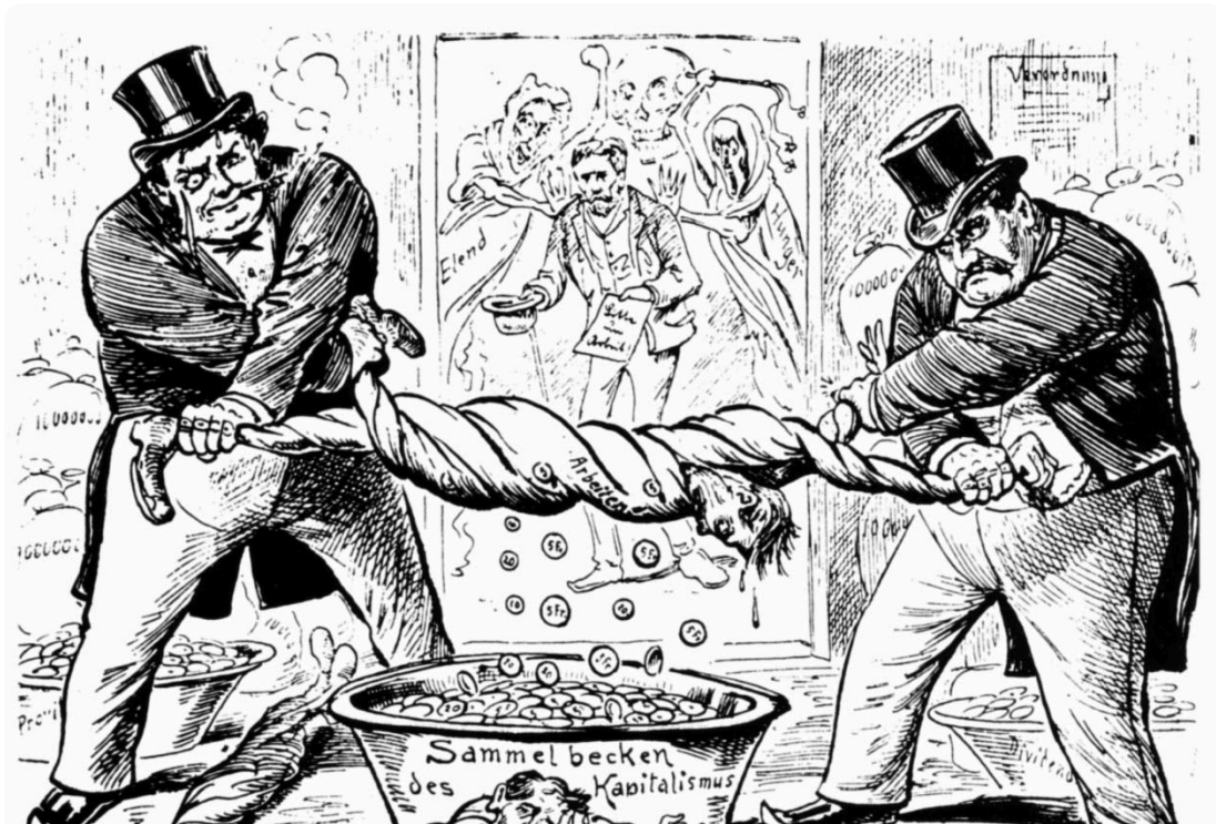
«Das neue Verhältnis zwischen Arbeiter und Unternehmer». Karikatur von 1896