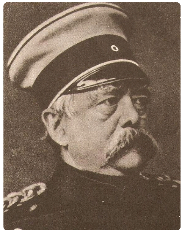
Otto von bismark