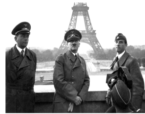
Q2: Hitler in Paris 23.6.1940