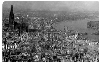
Q4: Das zerstörte Köln bei Kriegsende 24.4.1945