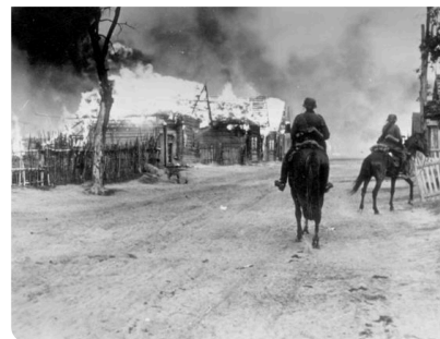
Q3: Deutsche Soldaten in einem brennenden Dorf in der Sowjetunion 16.7.1941