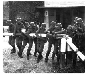
Q1: Deutsche Soldaten zerstören polnische Grenzanlagen 1.9.1939