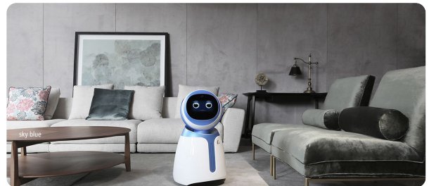
Kikoo | 小武 - Robot for Children