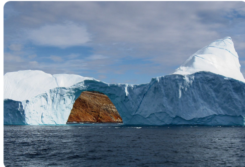
Iceberg with hole near Sandersons Hope 2007-07-28 2 CC