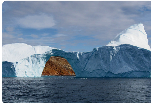
Iceberg with hole near Sandersons Hope 2007-07-28 2 CC