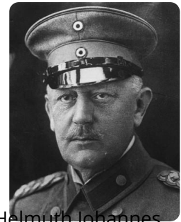
Helmuth Johannes Ludwig von Moltke 1914

③ Warum wollte man gerade Verdun einnehmen?