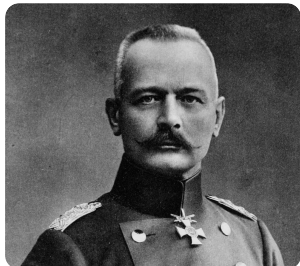
Erich von Falkenhayn

④ Wie sollte der Feind nach Ansicht von Generalstabschef Falkenhayn besiegt werden?