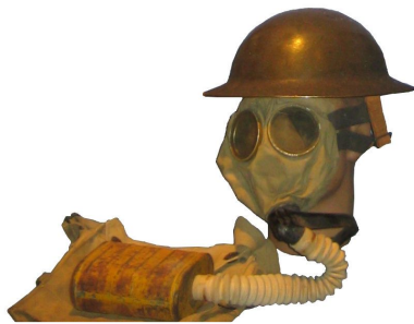
US WWI Gas mask with bag

⑧ Welche neuen Waffen wurden eingesetzt?