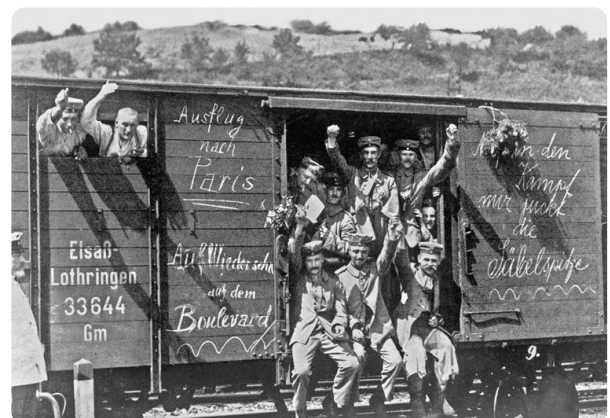
Abfahrt der Soldaten

⑨ Welche Rückwirkungen hatte diese Art der Kriegsführung auf die Stimmung der Soldaten? Vergleiche mit dem Kriegsausbruch!