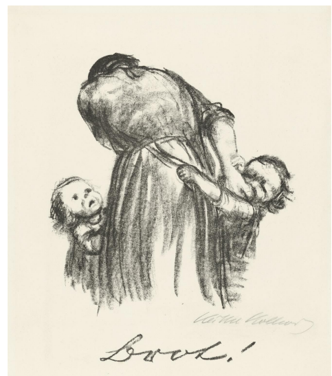
Abb.: Käthe Kollwitz (1924), „Brot!“

Wer bin ich? Wann und wie lebe ich? Was hat sich gerade oder in letzter Zeit ereignet? Wie fühle ich mich? Welche Hoffnungen und Befürchtungen habe ich für die Zukunft?