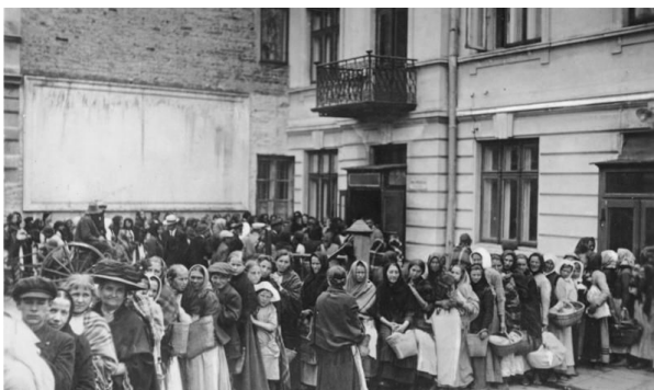
Abb.: Anstehen nach Brot in Deutschland

Doch für die Selbstversorgung des Volkes mit Lebensmitteln und anderen Rohstoffen war Deutschland ohnehin nicht ausgelegt. Viele Waren bezog es aus Übersee. Eine wichtige Rolle spielte vor allem der Kunstdünger. Durch den Kriegsausbruch verhängte Großbritannien die Seeblockade über Deutschlands Küsten: Das fehlende Düngemittel ließ die Produktion von Lebensmitteln weiter sinken.