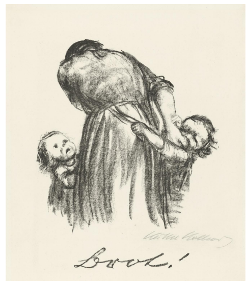
Abb.: Käthe Kollwitz (1924), „Brot!“

Wer bin ich? Wann und wie lebe ich? Was hat sich gerade oder in letzter Zeit ereignet? Wie fühle ich mich? Welche Hoffnungen und Befürchtungen habe ich für die Zukunft?