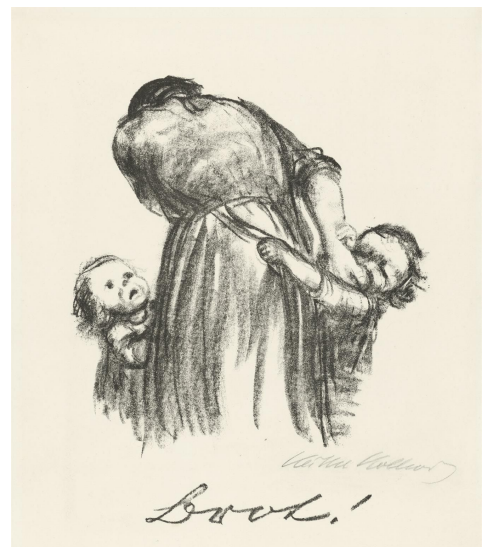
Abb.: Käthe Kollwitz (1924), „Brot!“

Wer bin ich? Wann und wie lebe ich? Was hat sich gerade oder in letzter Zeit ereignet? Wie fühle ich mich? Welche Hoffnungen und Befürchtungen habe ich für die Zukunft?