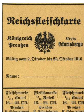
Abb. 1: Fleischkarte 1916

1915 entstanden in größeren Reichsstädten Suppenküchen, sogenannte „Kriegsküchen“, welche den Armen eine warme Mahlzeit für wenig Geld lieferten. Die dünne Suppe, die dort ausgegeben wurde, sättigte jedoch vergleichsweise wenig.